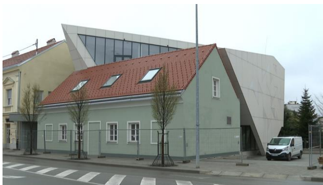
NIKOLA TESLA PODUZETNIČKI CENTAR (PPI)