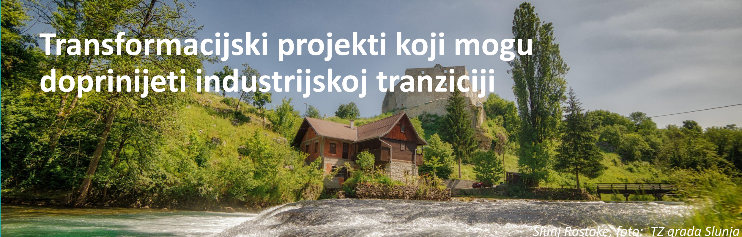
Slunj Rastoke