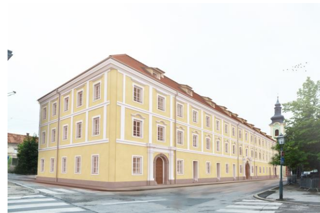
Regionalni centri kompetentosti u strukovnom obrazovanju

Mjesto izvrsnosti strukovnog obrazovanja i suradnje sa realnim sektorom