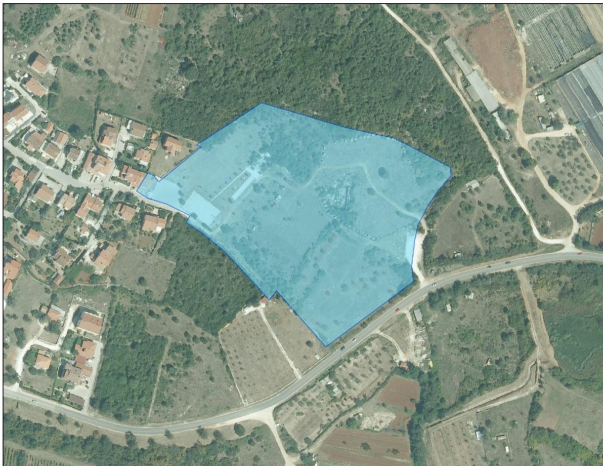
Slika 2: Prikaz lokacije zaštićenog područja Kamenoloma Fantazija - Cava di Monfiozeno