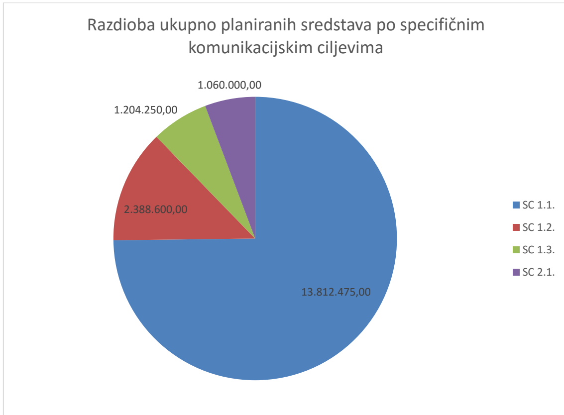
Grafikon 1: Razdioba ukupno planiranih sredstva po specifičnim komunikacijskim ciljevima

Kao i u prošlogodišnjem Planu (za 2016.) koji je imao usmjerenost na iste specifične komunikacijske ciljeve, i u ovogodišnjem Planu ostali specifični komunikacijski ciljevi će se provoditi u manjem opsegu te će se njihovo ostvarenje postizati u najvećoj mjeri u kasnijim godinama provedbe.